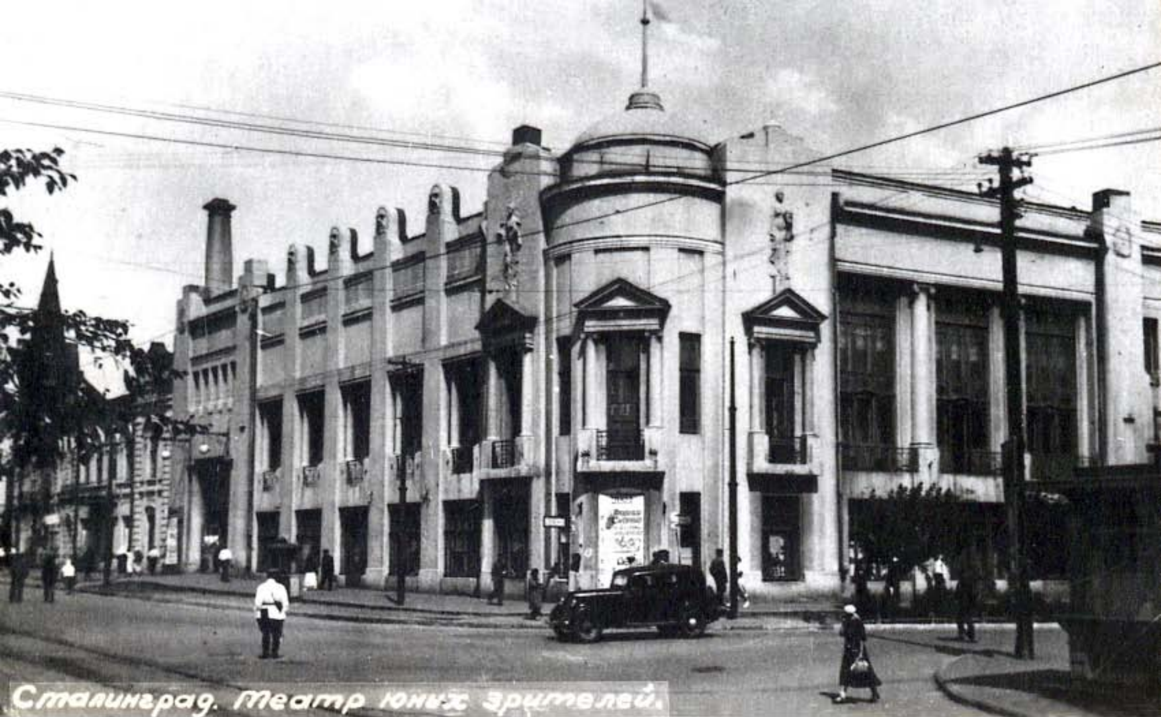
Бывший кинотеатр «Парнас», лучший в городе, построен в 1912 г. промышленником Миллером (угол ул. Ленина и Октябрьской). В 1920 г. в здании произошел большой пожар, после которого его отремонтировали только в 1925 г. Здесь размещался кинотеатр «Красноармеец», затем ТЮЗ. После Сталинградской битвы здание не восстанавливалось. ВОКМ: М-ЗСтБ, к. инв. № 7724, н/вф, № 19