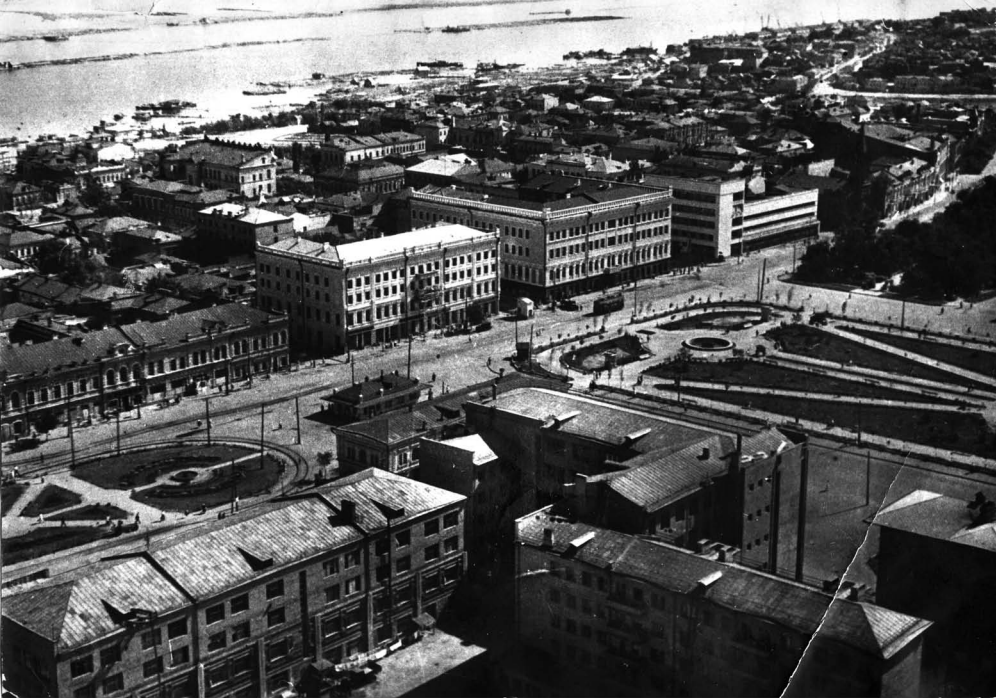
Надстройка 2 этажами 2-этажных зданий парижанской архитектуры в центре Сталинграда. Торговый корпус № 9 (внизу слева), дом Наркомтяжпрома (вверху с двумя балконами), Главпочтамт (рядом с трамваем). МВАР № 11-4292