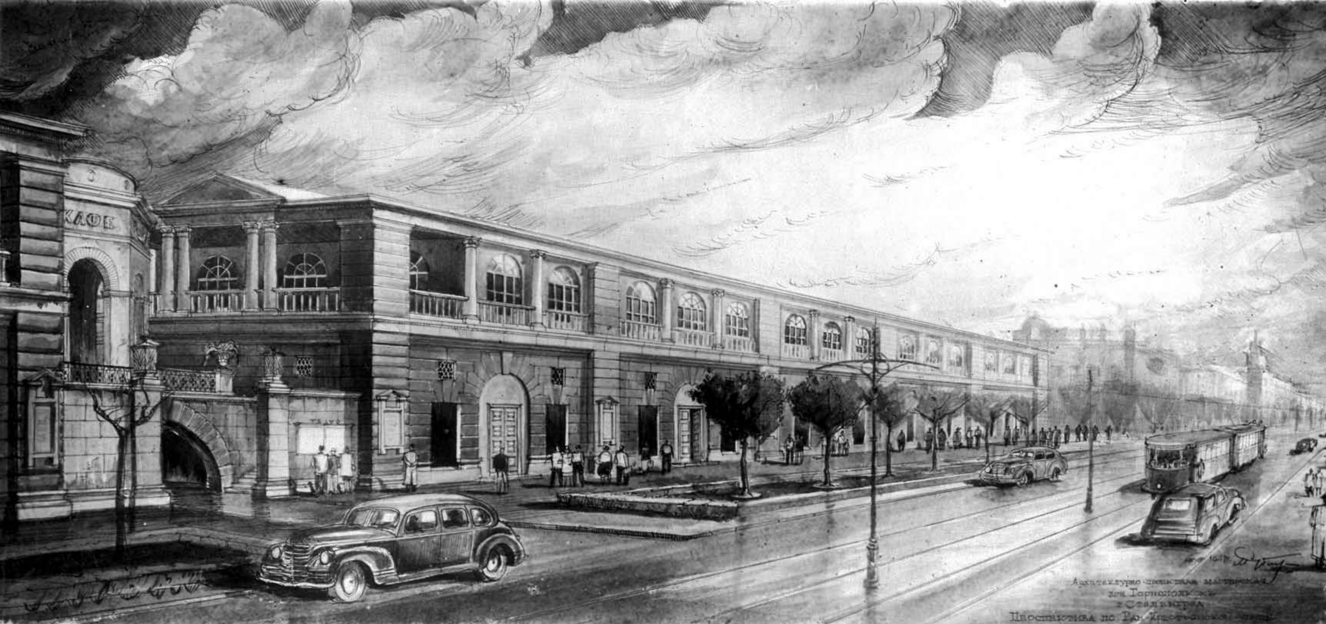
Проект дома Сталинградского горисполкома по ул. Рабоче-Крестьянской. 1947 г. Перспектива. Архитектор Л. Рубин