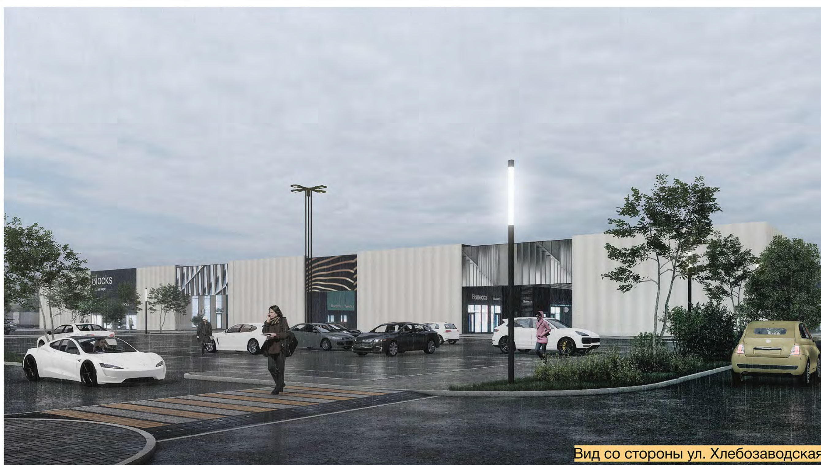
Вид со стороны ул. Хлебозаводская