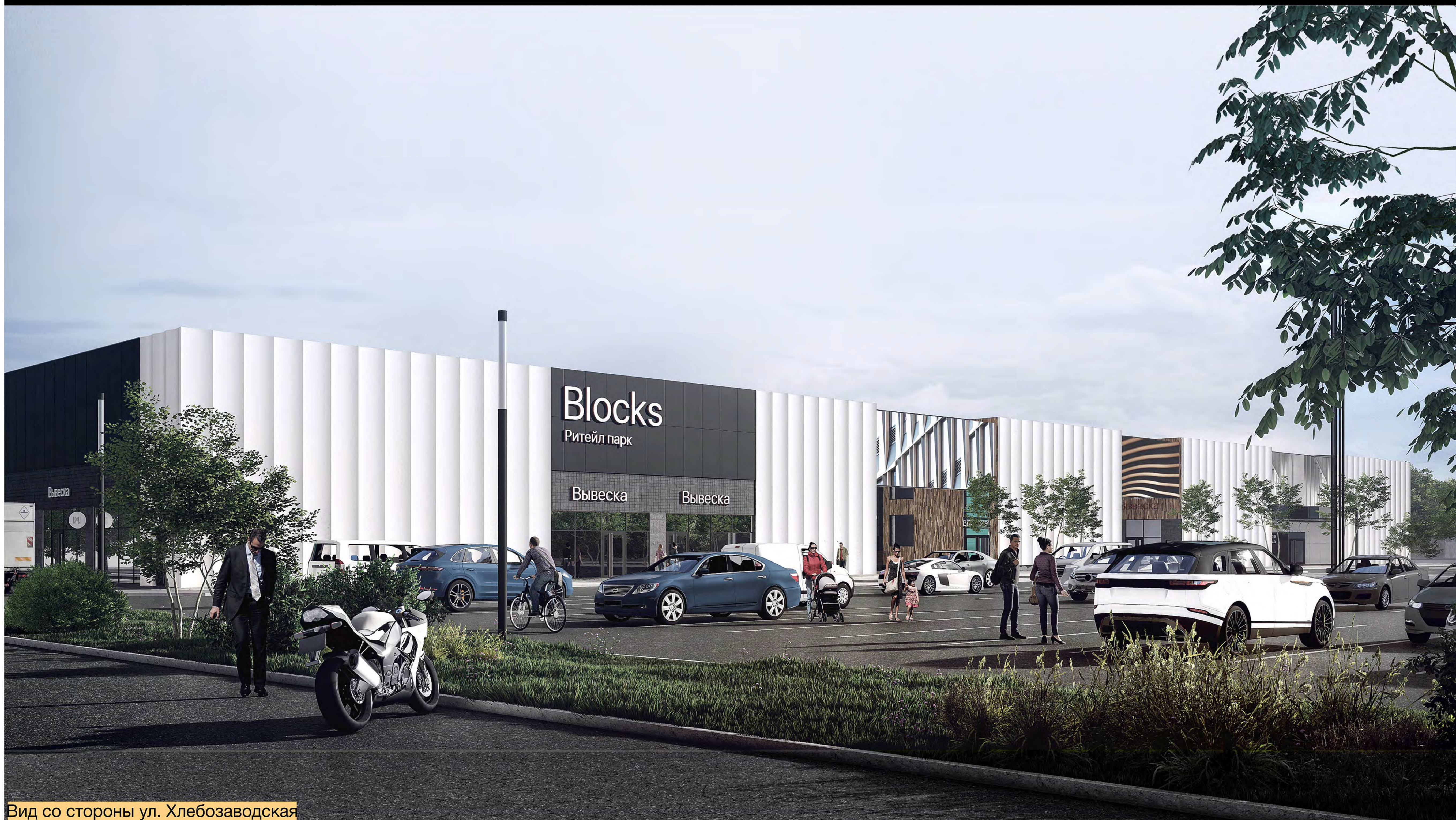
Вид со стороны ул. Хлебозаводская