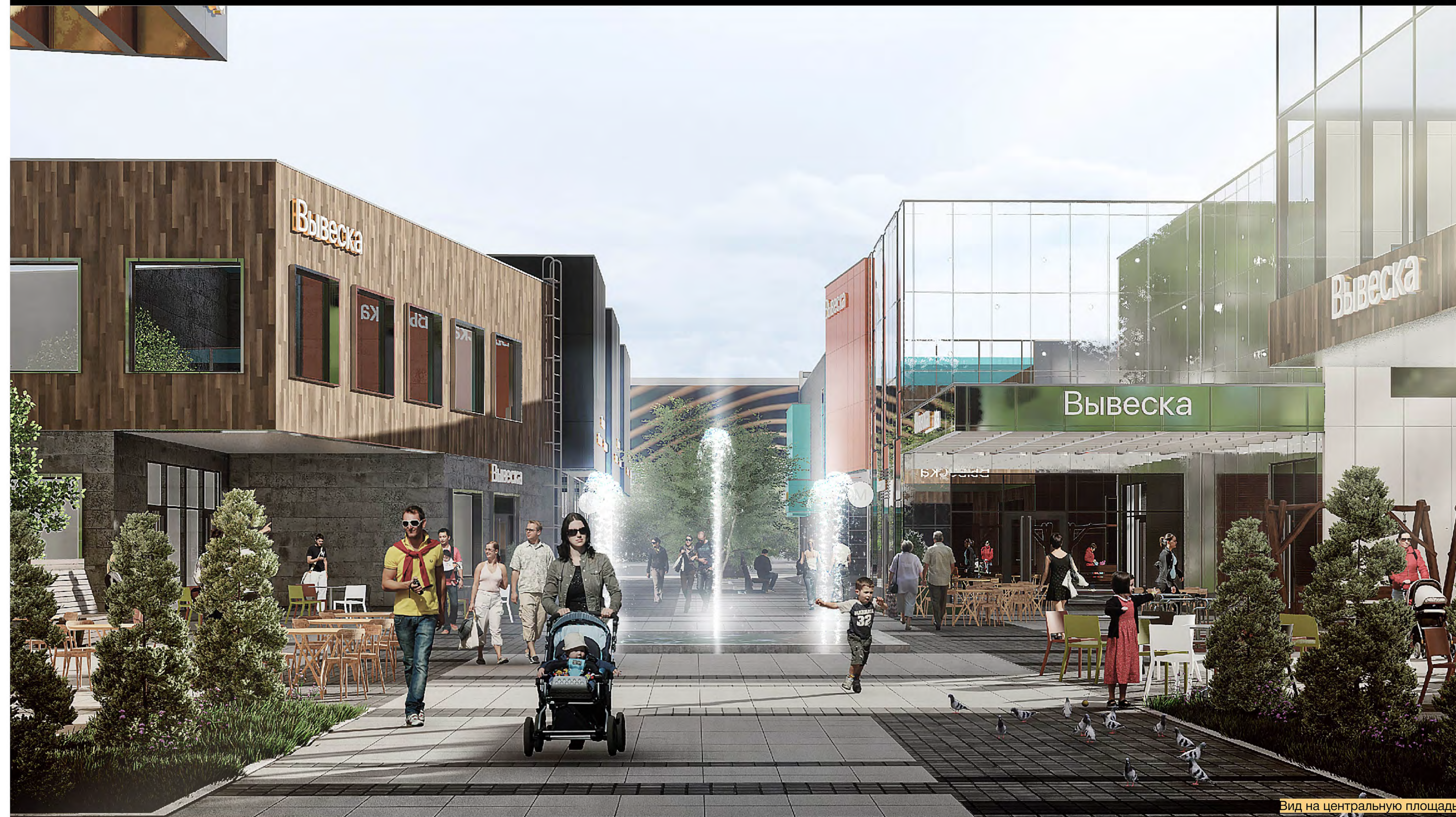
Вид на центральную площадь