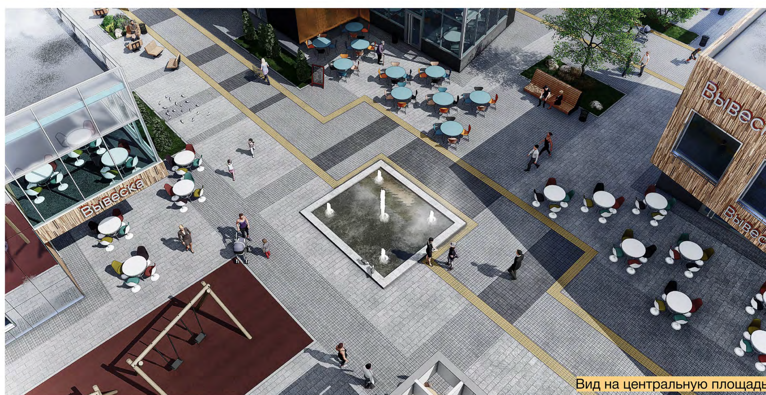
Вид на центральную площадь