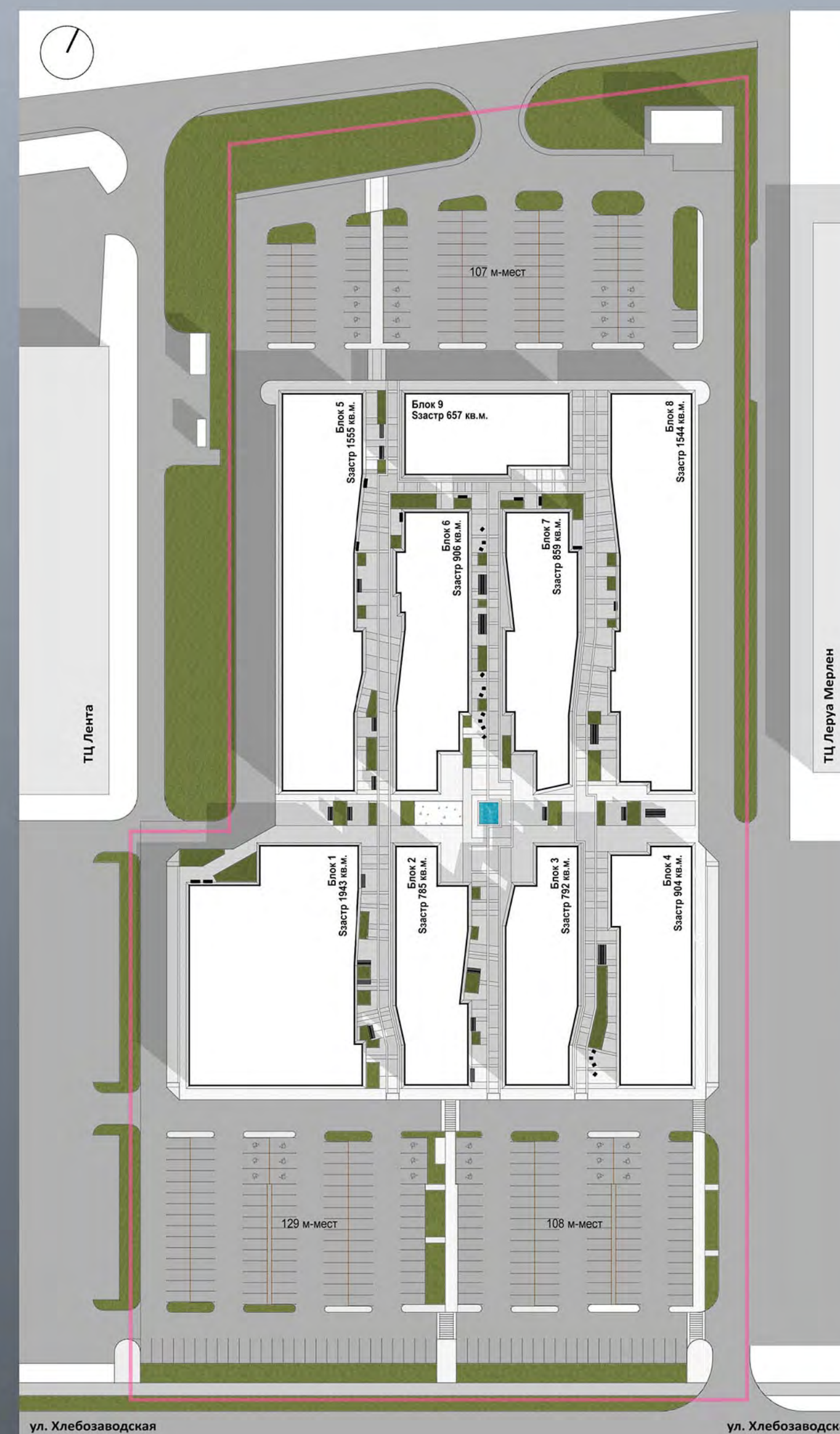
Схема генерального плана

Торговый комплекс расположен в Центральном районе Новокузнецка на ул. Хлебозаводская. Участок проектирования ограничен территорией ТЦ Леруа Мерлен и территорией ТЦ Лента. Площадь участка 3,76 га