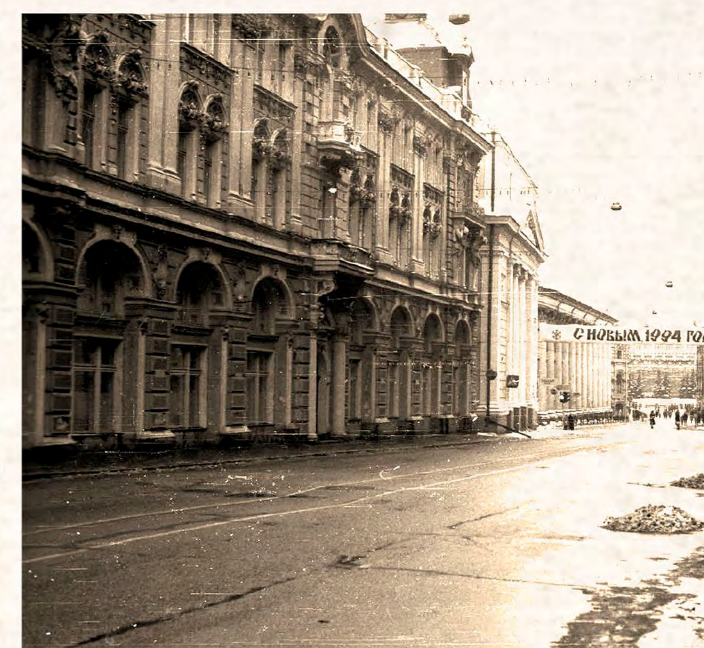
Илл. 1994 г.

В отношении фасадов объекта, кровельного покрытия и конструкций крыши коллективом ООО «Моспроект» был проведен комплекс натурных и инженерно-технических исследований. По их результатам был разработан проект ремонтно-реставрационных работ направленных на сохранение исторического облика памятника и на воссоздание части утраченных архитектурных элементов. Решения проекта не затрагивают внутреннего объемно-планировочного решения здания, конструкций и сохранившегося декоративного убранства интерьеров. На основании натурных исследований планируется выполнение следующих ремонтно-реставрационных работ: