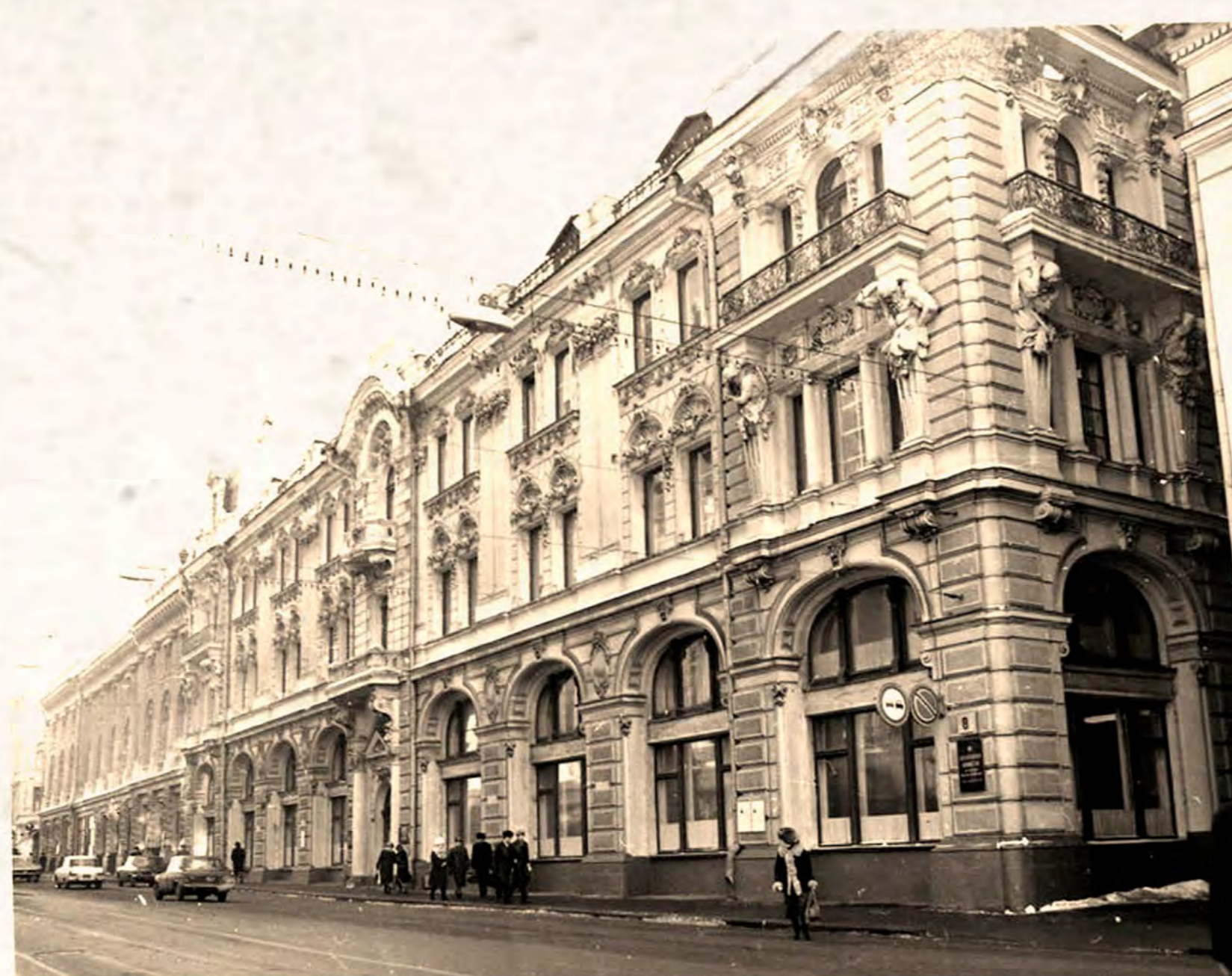
Илл. 1982 г.