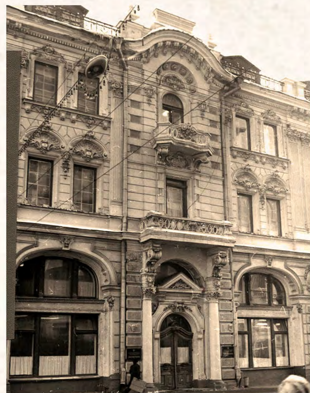
Илл. 1982 г.