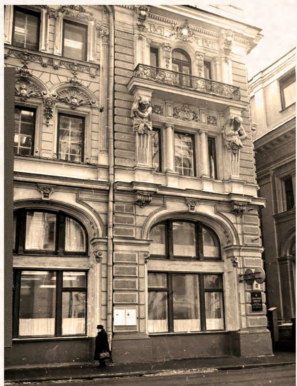
Илл. 1892 г.